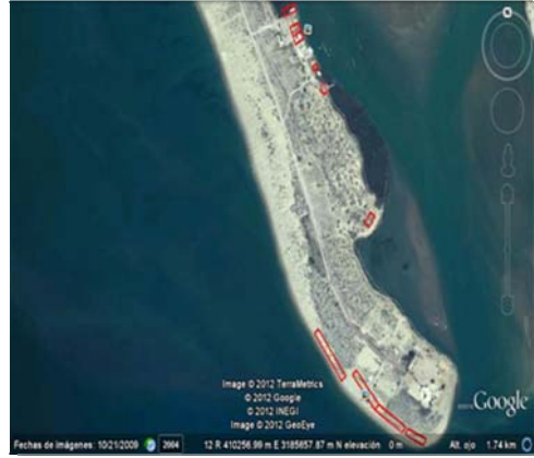
Figura 5a: Concesiones actuales en la Laguna La Cruz.