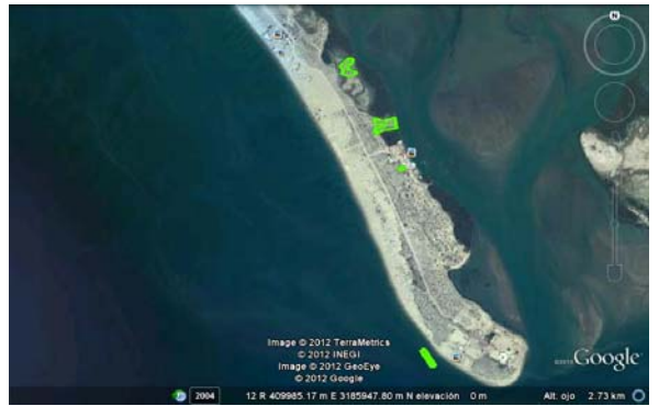
Figura 5b: Concesiones en trámite adyacentes a la Laguna La Cruz.