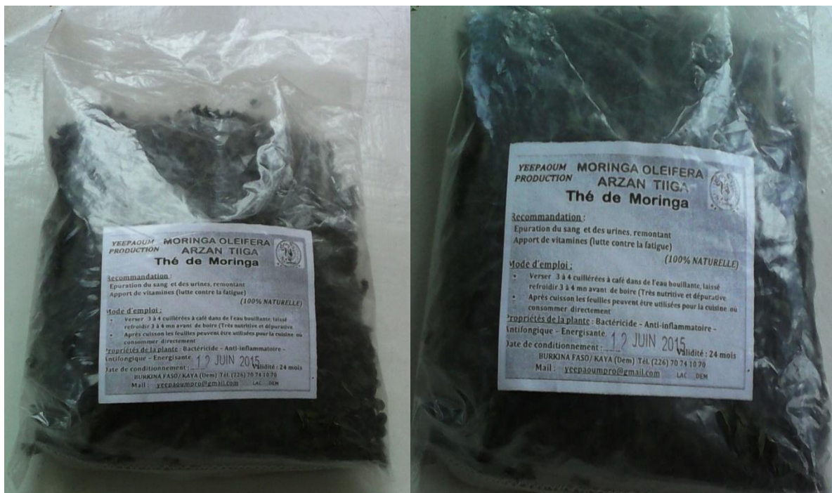
Figure 3: Produit dérivé de Moringa oleifera

Les recettes issues de la vente des mangues au lac Tengrela représentent 64,38% de la valeur économique totale générée par les PFNL dans la localité. Au Dem, la production du moringa constitue leur principale activité. Le moringa est transformé en poudre et en thé et est conditionné dans des emballages (cf. figure ci-après) vendu à 2000FCFA l'unité à kaya et à Ouagadougou. Ses produits sont aussi exportés vers des marchés extérieurs pour ses multiples vertus. Le Kilogramme de feuilles de moringa est vendu à 20.000 FCFA à la FAO. Ce qui contribue à l'amélioration des revenus des exploitants de la ressource. Le PFNL est produit sur une superficie de 6 Ha avec une production annuelle d'environ 260kg de feuilles.