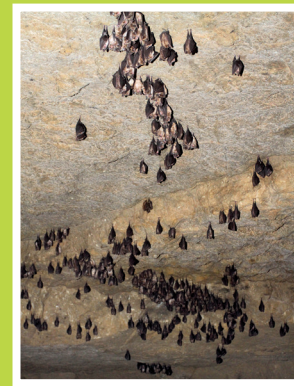
Colonie de Grand rhinolophe en hibernation.

Avec l'arrivée du froid, les chauves-souris s'installent dans leur gîte d'hiver pour hiberner, en groupe ou isolément selon les espèces. Elles cessent de s'alimenter, baissent leur température et leur rythme cardiaque. Tout dérangement peut leur être fatal.