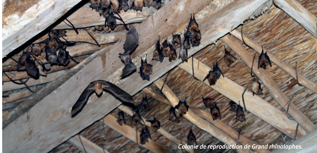
Colonie de reproduction de Grand rhinolophe.

Conception: © (01/2018) Illustrations: B. Perotin (07/2016) / Imprimé sur papier recyclé