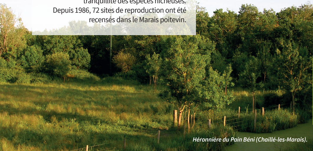
Héronnière du Pain Béni (Chaillé-les-Marais).

Aujourd'hui, leur préservation passe par le maintien des boisements. Il convient d'adapter les activités humaines afin de veiller à la tranquillité des espèces nicheuses. Depuis 1986, 72 sites de reproduction ont été recensés dans le Marais poitevin.