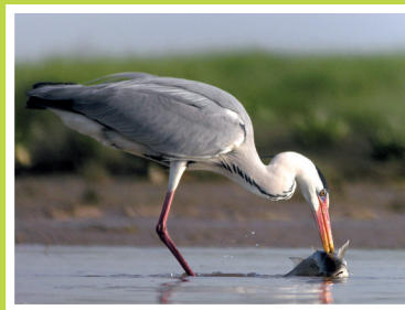
Un Héron cendré pêche un Mulet.