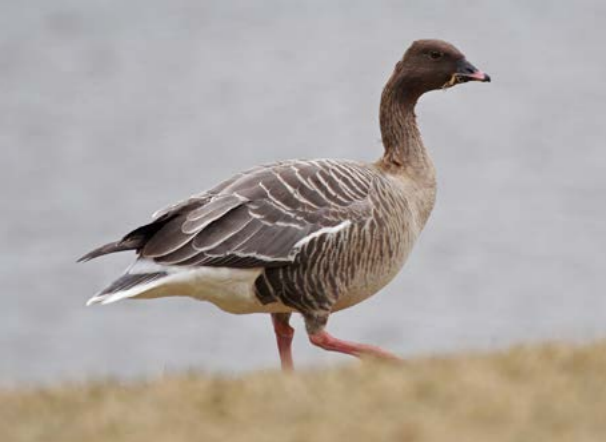
Kortnebbgås ( Anser brachyrhynchus )