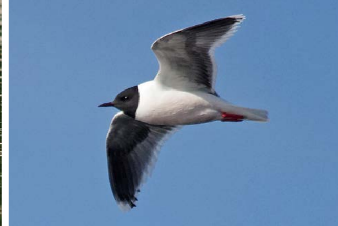
Dvergmåke ( Larus minutus )