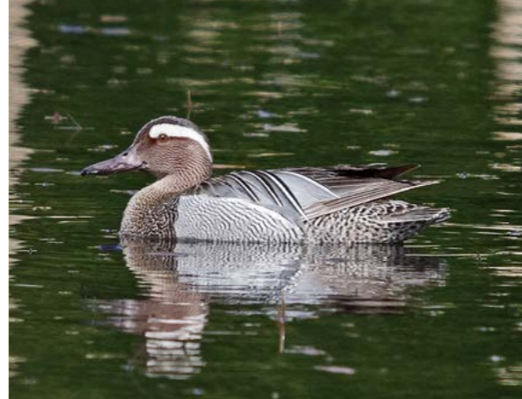
Knekkand ( Anas querquedula )