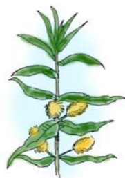
Gulldusk ( Lysimachia thyriflora )

Vegetasjonen i hele Lundselvoset er sterkt prega av beiting med storfe. Langs hele yttersida er det et belte med sumpsvivaks-botnegraseng. Ytterst ut mot åpent vatn er det partier med sjøsvivaks. Foruten flaskestarr er kvass-starr, bukkeblad og gulldusk vanlig. I motsetning til i Lyngås-Lysgård er taker nesten fraværende i Lundselvoset. Rundt utløpet av Lundselva er det også store arealer med lauvskog, dominert av gråor og bjørk.