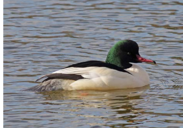
Laksand ( Mergus merganser )