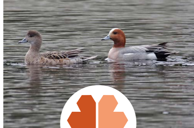
Brunnake ( Anas penelope )