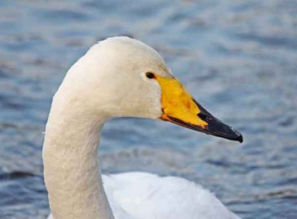
Sangsvane ( Cygnus cygnusa )