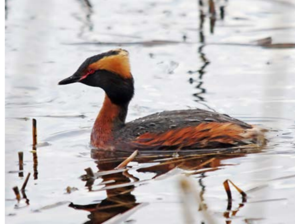
Horndykker ( Podiceps auritus )