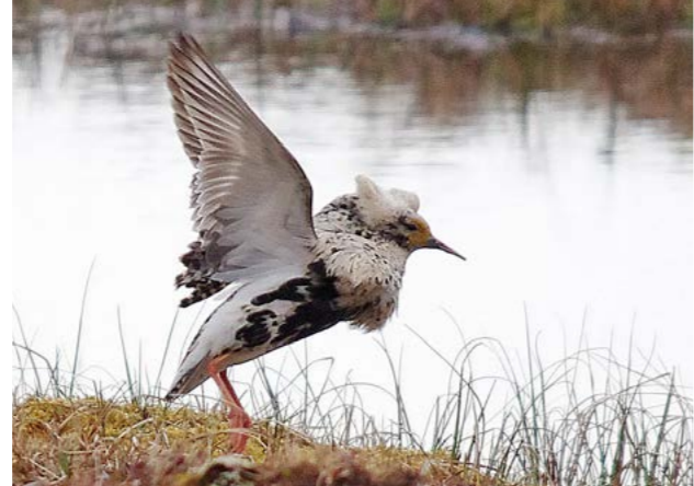
Brushane ( Aphilomachus pugnax ). Midten: Krikkand ( Anas crecca )