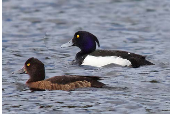
Toppand ( Aythya fuligula )