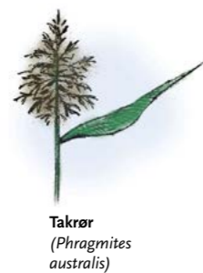
Takrør ( Phragmites australis )

Langs hele fuglefredningsområdet er det et bredt belte av vann- og vannkantvegetasjon med stor variasjon. Dominerende plantearter er takrør, sjøsvivaks, elvesnelle, hjerte-tjønna, hvit nøkkerose og gulldusk. Verneområdet grenser til dyrkamark i øst og til veg og barskog i sør.