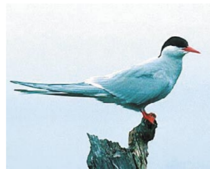
Rødnebbterne. Midten: Laukvikøyene.