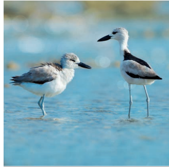
DROME ARDEOLE ( Dromas ardeola )

Il s'agit d'une des trois espèces de mygales de Mayotte, la seule vivant dans la zone intertidale de la vasière des Badamiers. Elle y occupe des trous dans les roches friables, qu'elle obture avec un opercule lors de la marée haute. Cette espèce se rencontre à Madagascar, aux Comores et aux Seychelles.