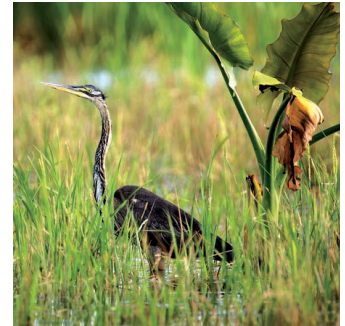
HÉRON DE HUMBLLOT ( Ardea humbloti )

Aussi appelé pluvier crabier, cet oiseau mesure environ 40 cm. C'est un limicole noir et blanc très caractéristique avec son gros bec disproportionné par rapport à la tête. Il a de longues pattes gris bleu. Nicheur possible, il hiverne à Mayotte en petit nombre. Sa répartition mondiale étant restreinte, il mérite une attention particulière, sa population ici pourrait représenter 1 % de la population mondiale.