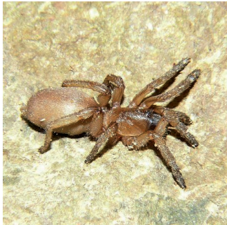
IDIOCTIS INTERTIDALIS ( Idiactis intertidalis )

Il s'agit d'une des trois espèces de mygales de Mayotte, la seule vivant dans la zone intertidale de la vasière des Badamiers. Elle y occupe des trous dans les roches friables, qu'elle obture avec un opercule lors de la marée haute. Cette espèce se rencontre à Madagascar, aux Comores et aux Seychelles.