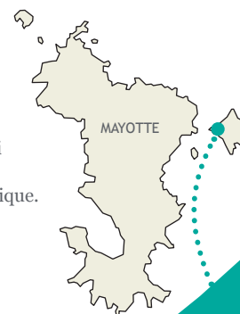
Vasière des Badamiers

Le site est situé à l'ouest de Petite-Terre, entre les villes de Dzaouzi et Labattoir, à Mayotte, dans le canal du Mozambique.