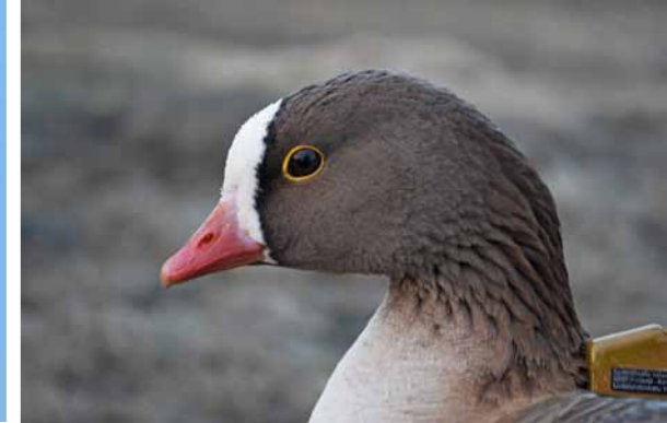
Dverggås/Lesser White-fronted Goose ( Anser erythropus ) Foto: Ingar Jostein Øien (Norsk Ornitologisk Forening).