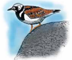
Steinvender Ruddy Turnstone ( Arenaria interpres )