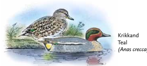
Krikkand Teal ( Anas crecca )

Området er et fjærfellingsområde for ender og et overvintringsområde, spesielt for ærfugl som er her hele året, men i størst antall om høsten og utover vinteren. På de store strandengene raster det mest gressender og gjess, der krikkand, stokkand, brunnakke, sædgås og dverggås opptrer i størst antall. Gruntvannsområdene brukes av fiskender og dykkender. Laksand, siland, sjøorre og svartand kan finnes i store antall, først og fremst i mytjetida (fjærfellinga) om sommeren.