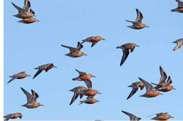
Polarsnipe/Knot ( Calidris canutus )