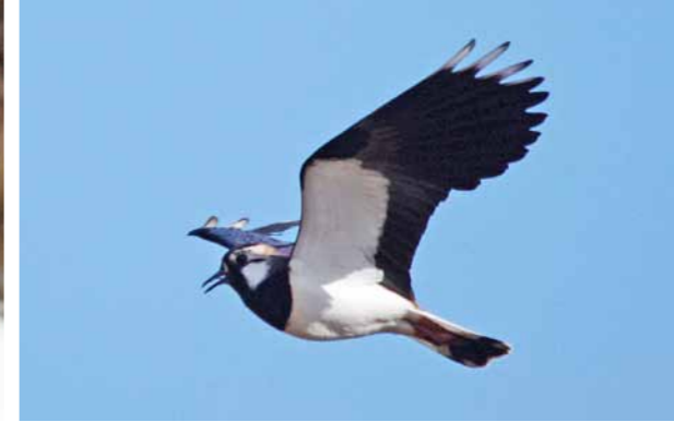
Vipe/Northern Lapwing ( Vanellus vanellus )