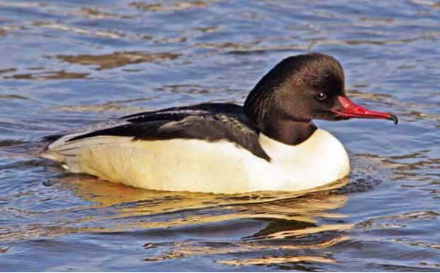
Laksand/Goosander ( Mergus merganser ).