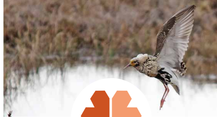
Brushane/Ruff ( Philomachus pugnax )