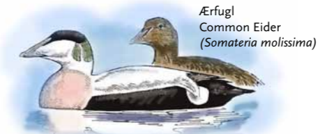
Ærfugl Common Eider ( Somateria mollissima )

The area is a moulting area for ducks and a wintering area, especially for Eiders as is here all year, but in the greatest number in the fall and winter. At the large salt meadows does mostly dabbling ducks and geese rest. Teal, Mallard, Wigeon, Bean Goose and Lesser White-fronted Goose is seen in the largest numbers. Shallow water areas are used by fish ducks and diving ducks. Goosander, Red-breasted Merganser, Velvet Scoter and Black Scoter can be found in large numbers, primarily during the moulting season in the summer.