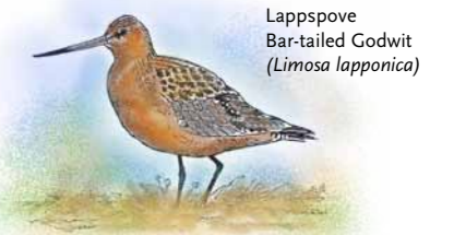
Lappspove Bar-tailed Godwit ( Limosa lapponica )

The Lesser White-Fronted Geese arrive the Valdak marshes in the middle of May and goes on to their breeding grounds in the first half of June. After the breeding season they come back here in the second half of August and leave for they wintering area in the first half of September. To protect the geese that rest at the Valdak Marshes all traffic is banned from the area during spring and fall migration.