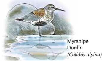
Myrsnipe Dunlin ( Calidris alpina )

Dverggjessene kommer til Valdakmyra i midten av mai og drar videre til hekkeplassene på Finnmarksvidda i første halvdel av juni. Etter hekkesongen kommer dverggjessene tilbake hit i andre halvdel av august og drar i første halvdel av september. For å skjerme dverggjessene som raster på Valdakmyra er det ferdsselsforbud her under vår- og høsttrekket.