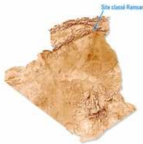
Surface du Site classé Ramsar: 2154 ha