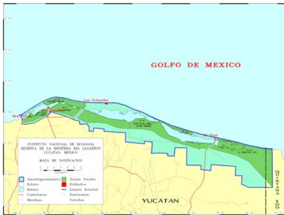
Mapa de Zonificación