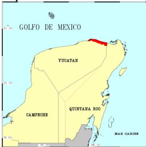
Mapa de ubicación