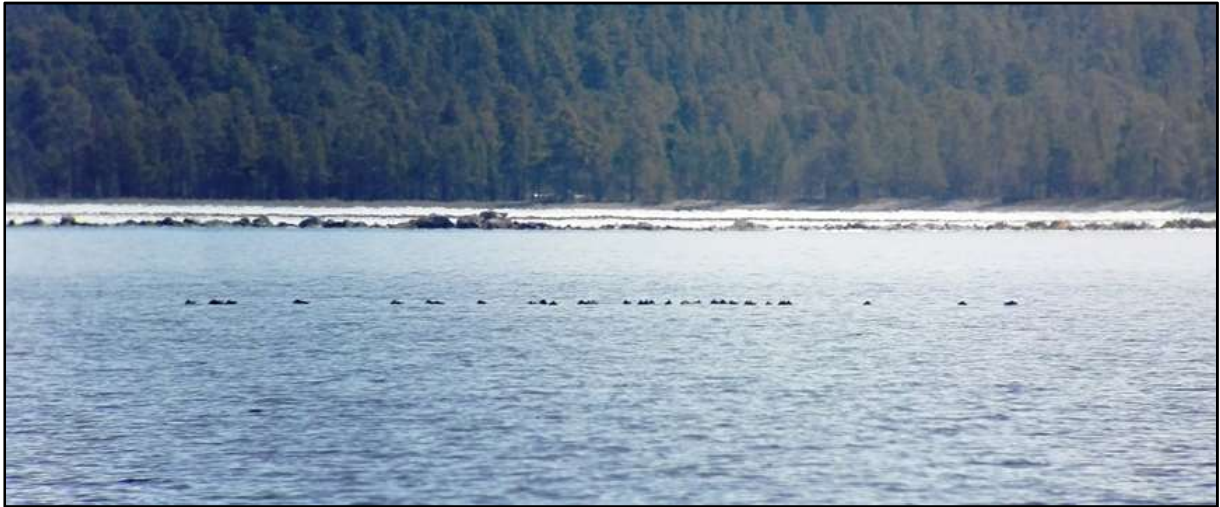
Utenfor munningen av deltaet lå det den 11. mai en flokk på 38 svartender.

Arten sees mye oftere enn sjøorre i verneområdet. Hvert år kommer flere hunner ut på vannet med ungekull. Den 11. mai lå det 38 svartender i en tidvis tett flokk utenfor munningen av deltaet. Samtidig lå det 5 hanner og 4 hunner like vest for utløpet av elva, til sammen 47 rastende svartender .