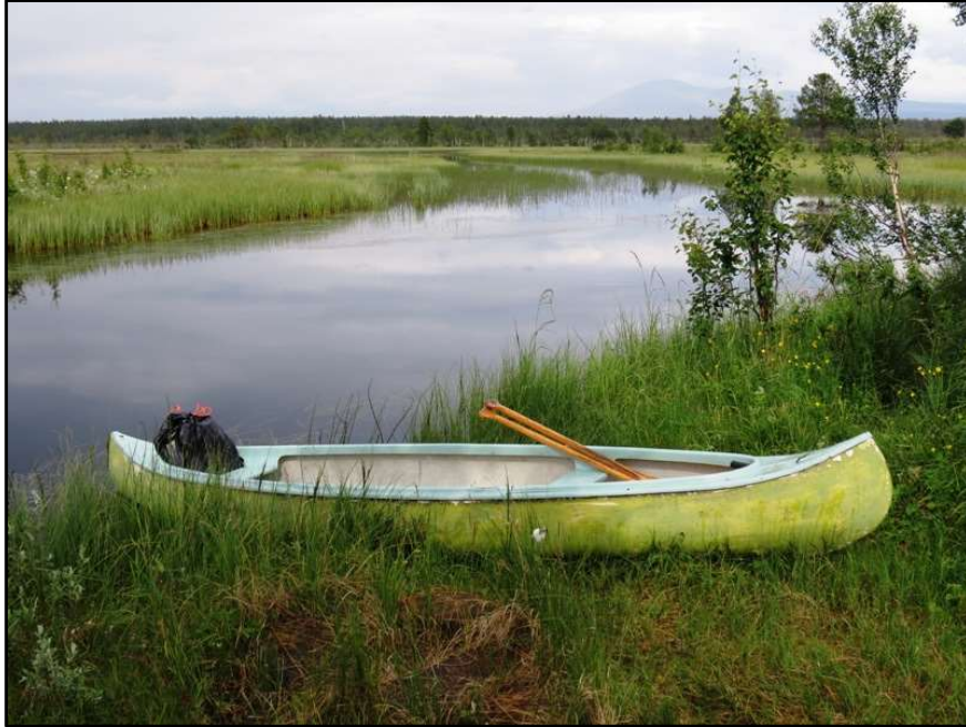
Østre Tjønnan 23. juli.