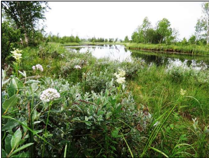
Frodig vegetasjon langs Tufsinga i nærheten av Punnibakkbu 23. juli.