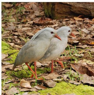
CAGOU ( Rhynochetos jubatus )

Emblème de la Nouvelle-Calédonie, il est unique au monde. Il a perdu sa faculté de voler puisque, avant l'arrivée de l'homme, il n'avait pas de prédateur. Son cri s'apparente plus à l'aboïement d'un chien. Il vit en couple stable dans les forêts humides de moyenne et haute altitudes. De nos jours, le Parc provincial de la Rivière Bleue abrite, entre autres, les plus grandes populations de cagous.