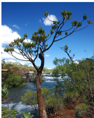
BOIS BOUCHON ( Retrophyllum minus )

Emblème de la Nouvelle-Calédonie, il est unique au monde. Il a perdu sa faculté de voler puisque, avant l'arrivée de l'homme, il n'avait pas de prédateur. Son cri s'apparente plus à l'aboïement d'un chien. Il vit en couple stable dans les forêts humides de moyenne et haute altitudes. De nos jours, le Parc provincial de la Rivière Bleue abrite, entre autres, les plus grandes populations de cagous.