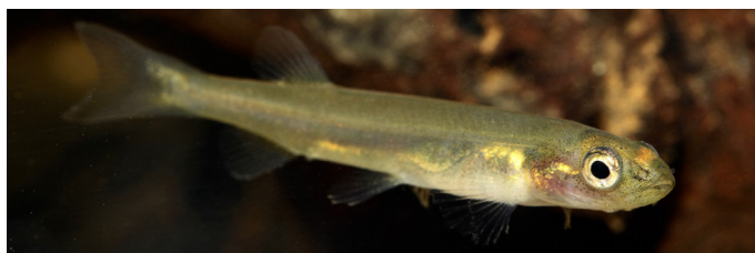
GALAXIAS ( Galaxias neocaledonicus )

Essentiellement dans le Sud de la Grande Terre, ce petit arbuste à l'allure de Baobab pousse les pieds dans l'eau. Il était autrefois utilisé par les mineurs pour la confection de bouchons. Cette espèce est si bien adaptée à son environnement qu'elle peut résister plusieurs jours à une submersion totale.