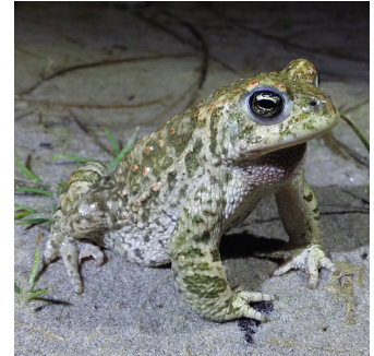
CRAPAUD CALAMITE ( Epidalea calamita )

Petite orchidée protégée au niveau national, elle est présente sur plusieurs stations en Baie d'Audierne. Les plus connues sont les anciennes carrières d'extraction de sable de Kerharo et de Kerboulén, qui forment des dépressions humides arrières-dunaires propices au développement de l'espèce.