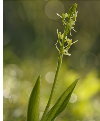
LIPARIS DE LOESEL ( Liparis Loselii )

La Baie d'Audierne, située sur la voie de migration de cet oiseau, est engagée dans le plan d'actions et accueille l'espèce chaque année dans les roselières et les prairies humides du territoire.