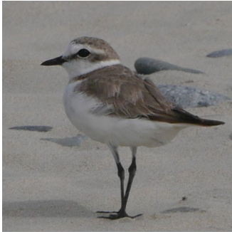
GRAVELOT À COLLIER INTERROMPU ( Charadrius alexandrinus )

La Baie d'Audierne est le 3ème site de reproduction breton de ce petit limicole protégé, et menacé d'extinction en Bretagne, en France et en Europe.