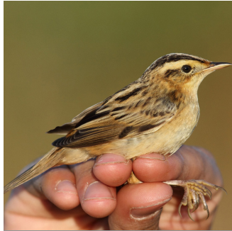
PHRAGMITE AQUATIQUE ( Acrocephalus paludicola )

En Baie d'Audierne, la reproduction du gravelot fait l'objet d'un suivi et le public est sensibilisé aux enjeux de sa conservation.