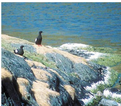
Teist.