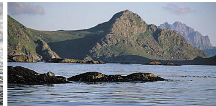
Hvileskjær for steinkobbe på Stø med Nyksundfjellene i bakgrunnen.