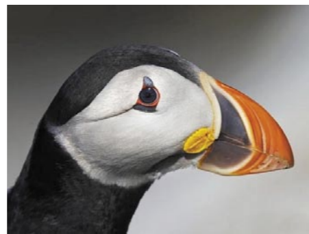
Lunde. Midten: På Anda har lundefuglen har gravd reirganger som gjennomhuller nesten hele øya.