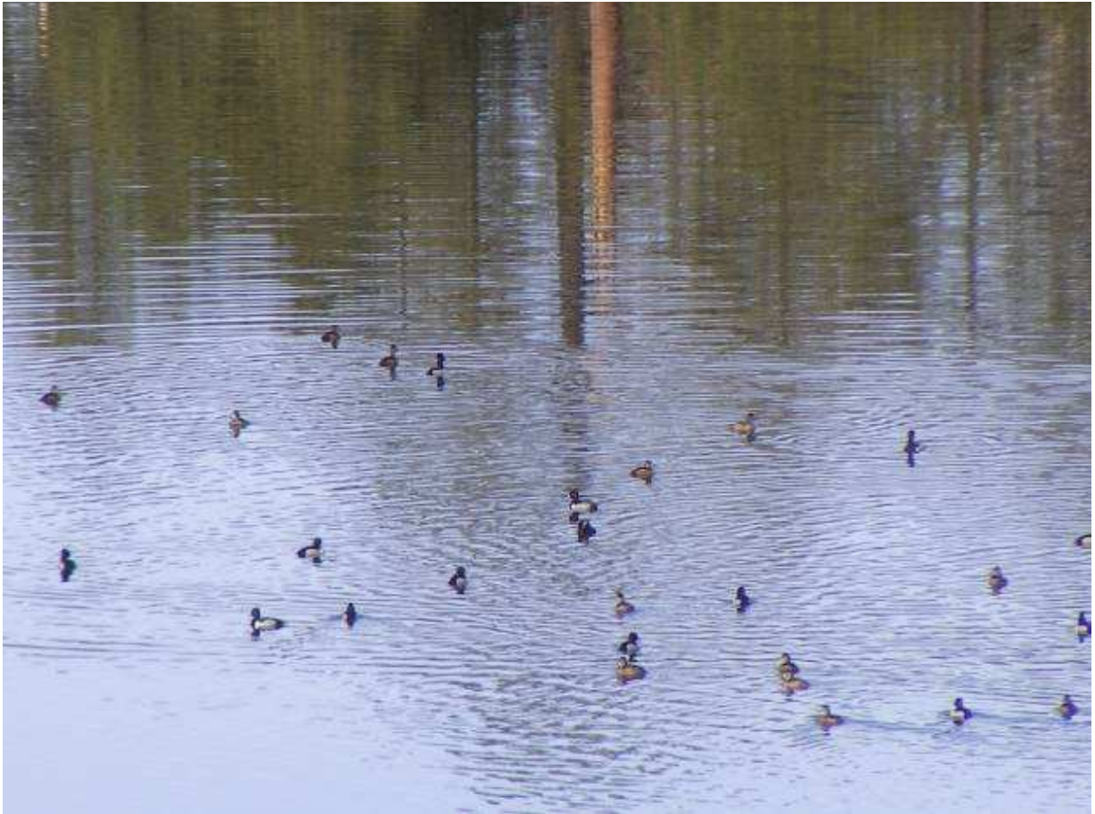
Figura 8. Grupo de Anátidos descanso en la Laguna Hanson