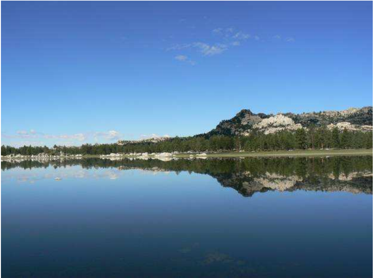
Figura 2. Laguna Hanson