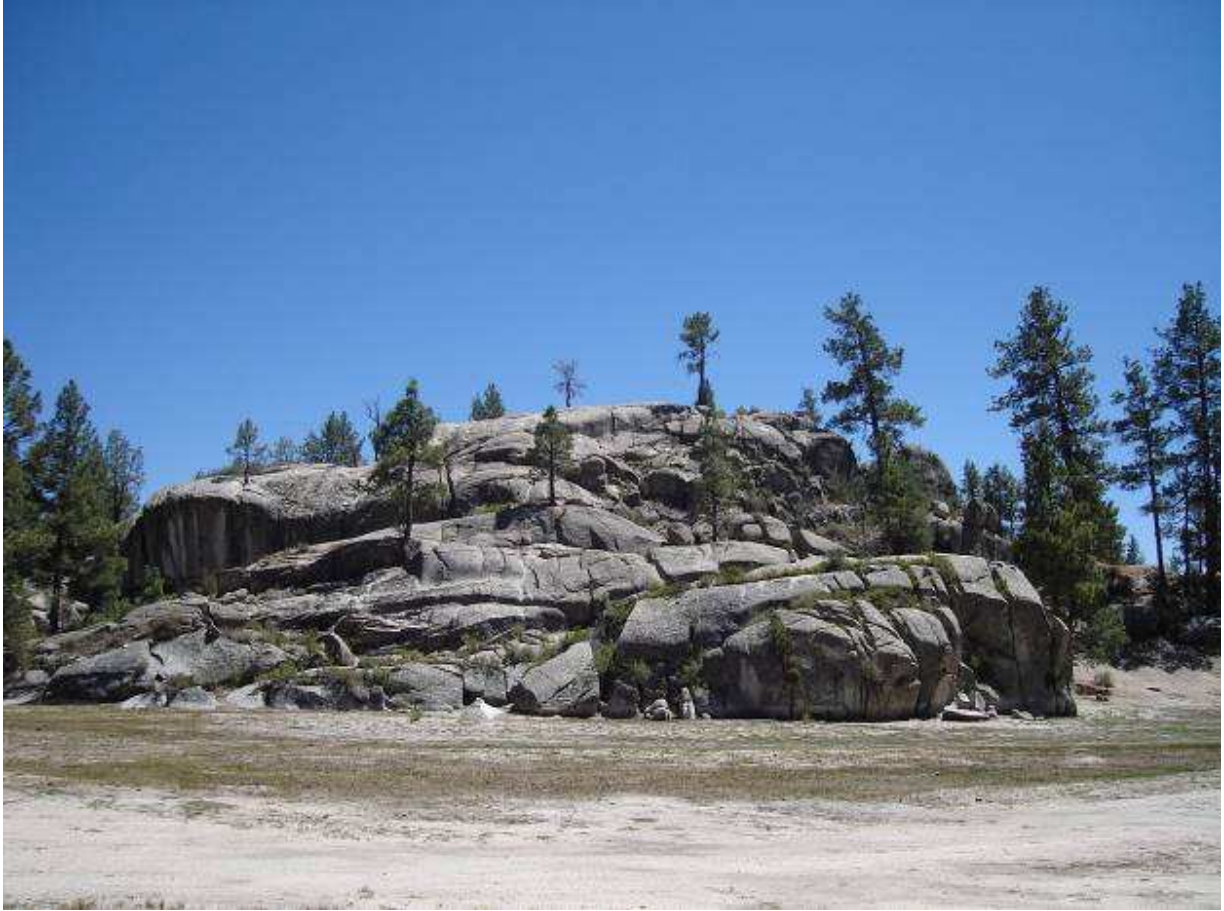
Figura 3 Laguna chica en temporada de sequía.