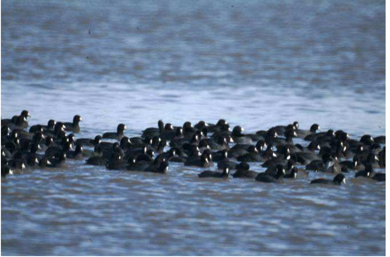
Figura 6. Gallaretas ( Fulica americana ). Estas fueron observadas alimentándose y son parte de grupo de aves migratorias