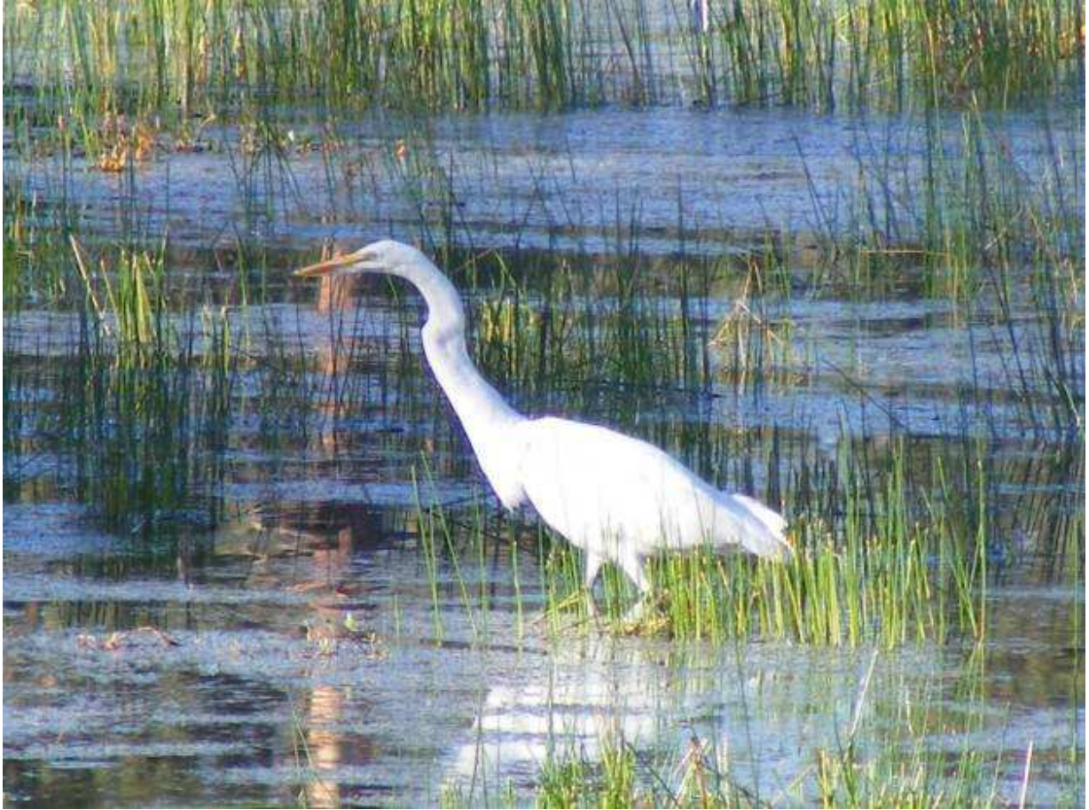
Figura 5. Garza de dedos dorados ( Ardea alba ), alimentándose en laguna Hanson