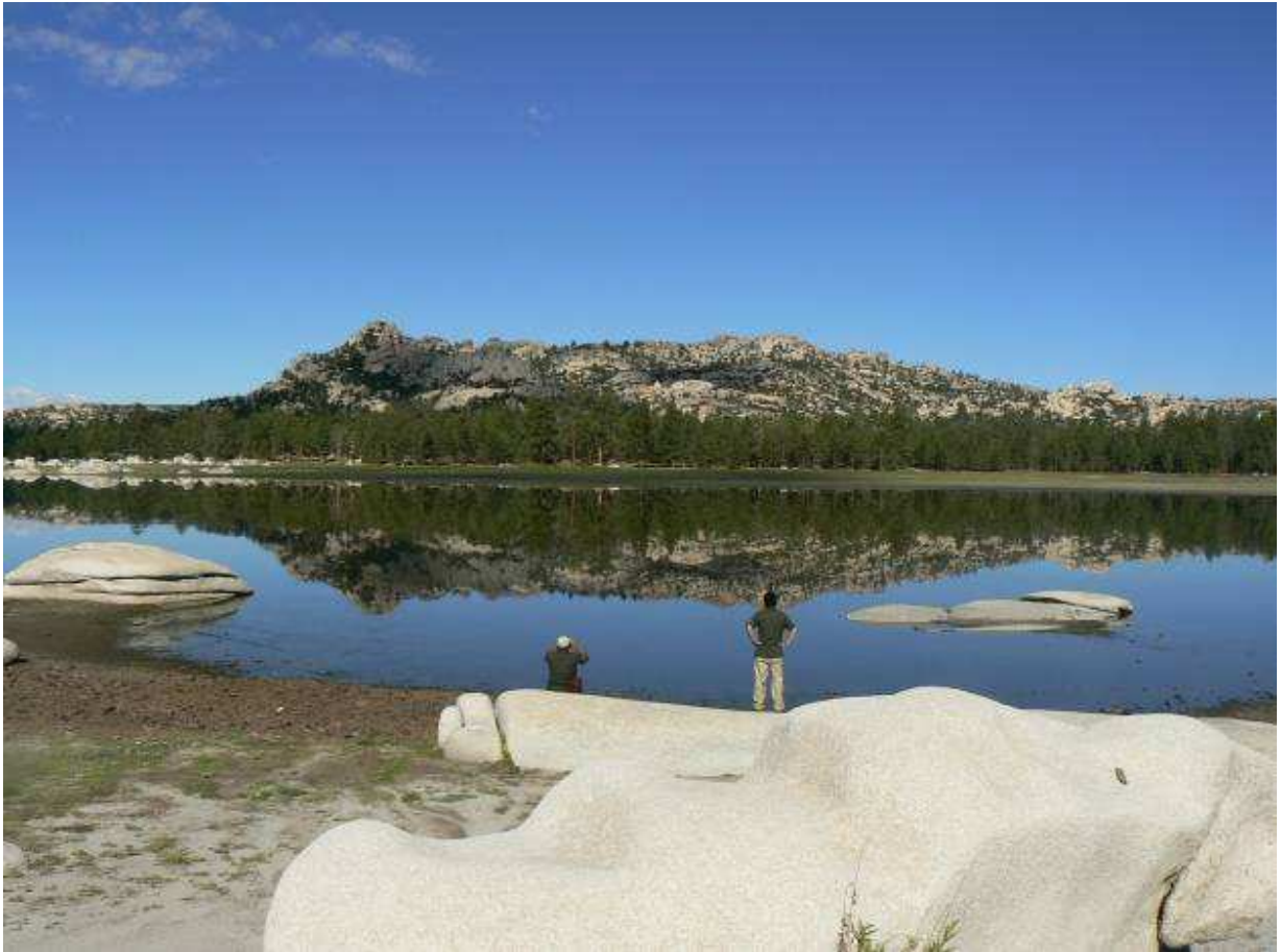
Figura 7. Laguna Hanson (Personal de la CONANP realizando el monitoreo de aves)