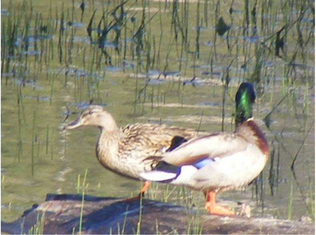
Figura 9. Pareja de Patos Mexicano ( Anas platyrhynchos ), descansando en la Laguna Hanson.