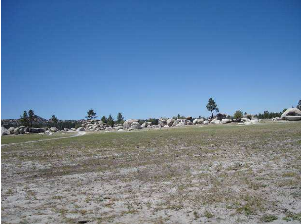
Figura 4. Laguna Hanson en temporadas de sequía.