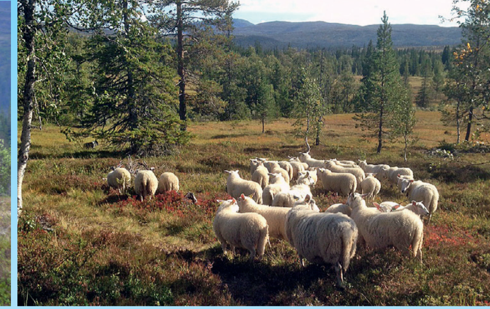
Sau i Øvre Forra