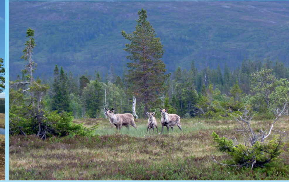
Rein i Øvre Forra