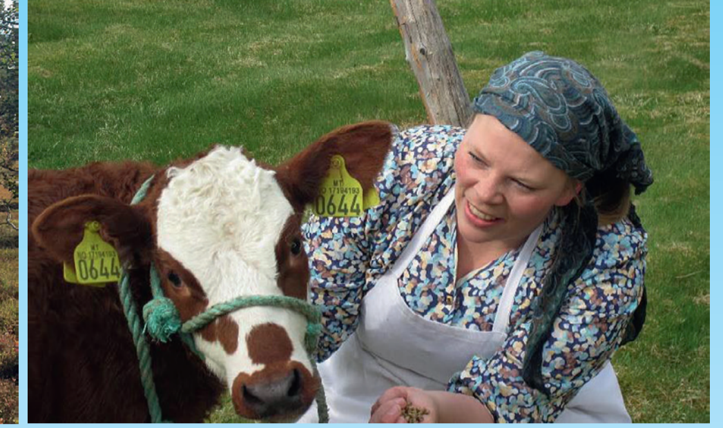
Seterdrift på Roknesvollen