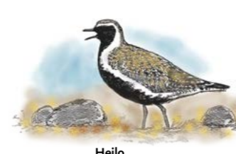
Heilo ( Pluvialis apricaria )