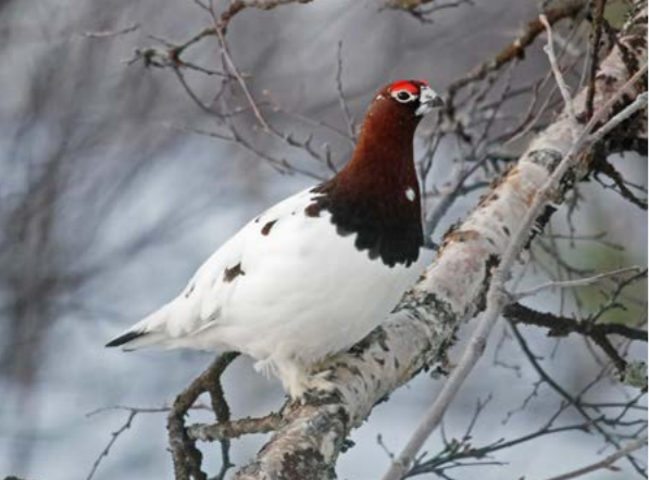
Lirype ( Lagopus lagopus ).