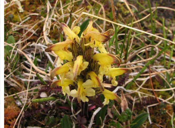
Gullmyrklegg ( Pedicularis oederi ).