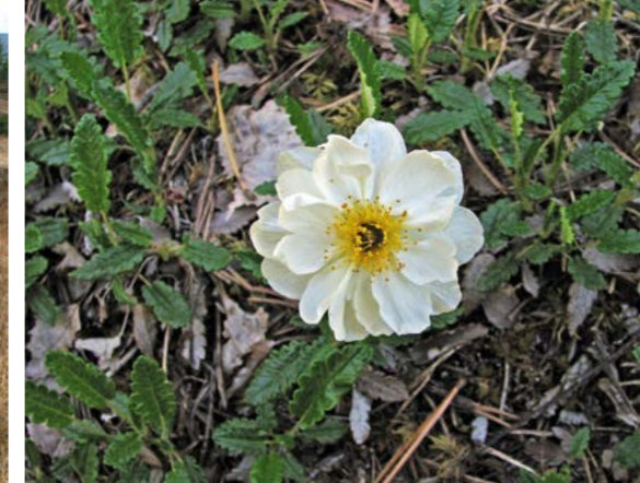
Reinrose ( Dryas octopetala ).