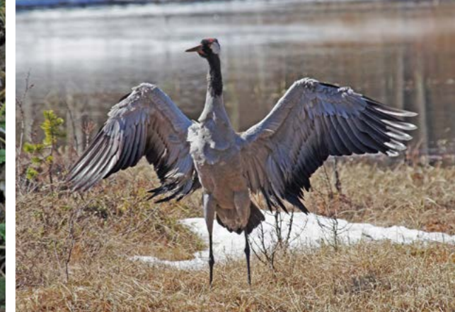
Trane ( Grus grus ).