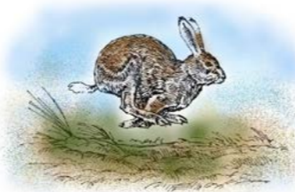
Hare ( Lepus timidus )