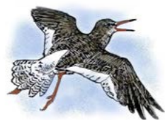
Rødstilk ( Tringa totanus )

Det er registrert mer enn 130 ulike fuglearter i området, derav er mer enn 70 arter påvist hekkende. De varierte myrområdene gir grunnlag for en stor bestand av vadefugler. Spesielt tallrike er heilo, enkeltbekkasin, småspove og rødstilk. Også vipe, rugde, grønnstilk, gluttsnipe og strandsnipe hekker vanlig her. Dobbeltbekkasin har flere spillplasser i området.