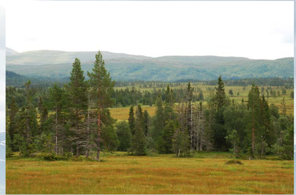
Rik flatmyr like vest for Heståa med Glonkvola og Fersvola i bakgrunnen.