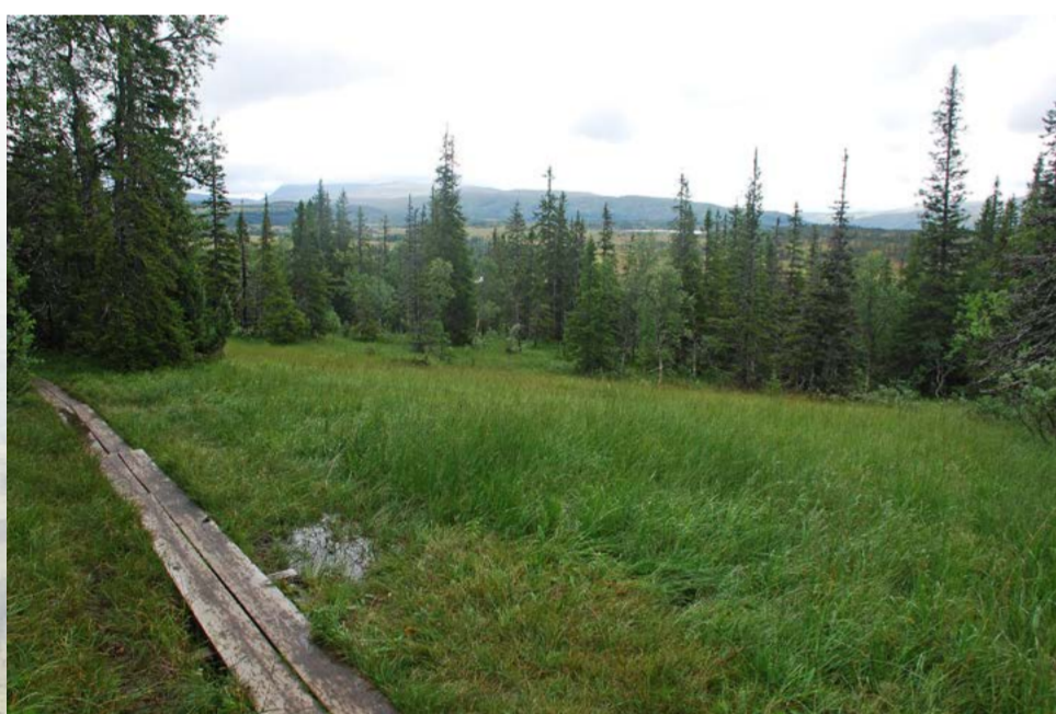
Denne myra ligger nedenfor stien litt nord for der du står nå. Bildene viser situasjonen før og etter rydding og slått.

Øvre Forra Nature Reserve was protected in 1990. The County Governor of Nord-Trøndelag has administrative responsibility for the reserve, and the management is undertaken by the Norwegian Nature Inspectorate. The NTNU Museum of Natural History and Archaeology has conducted surveys, monitoring and research in the reserve since the 1970s.