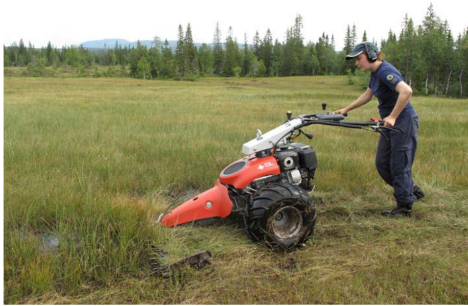
Slått med tohjulsaktor.