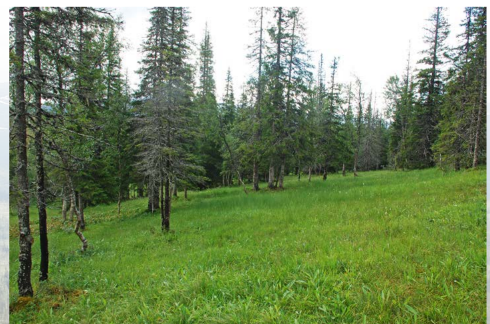
Engskog var viktig slåttemark, og den produktive vegetasjonen med mye urter ga godt høy.