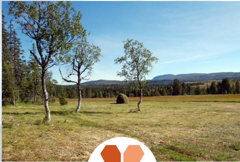
Etter slåtten på Heståslættet.