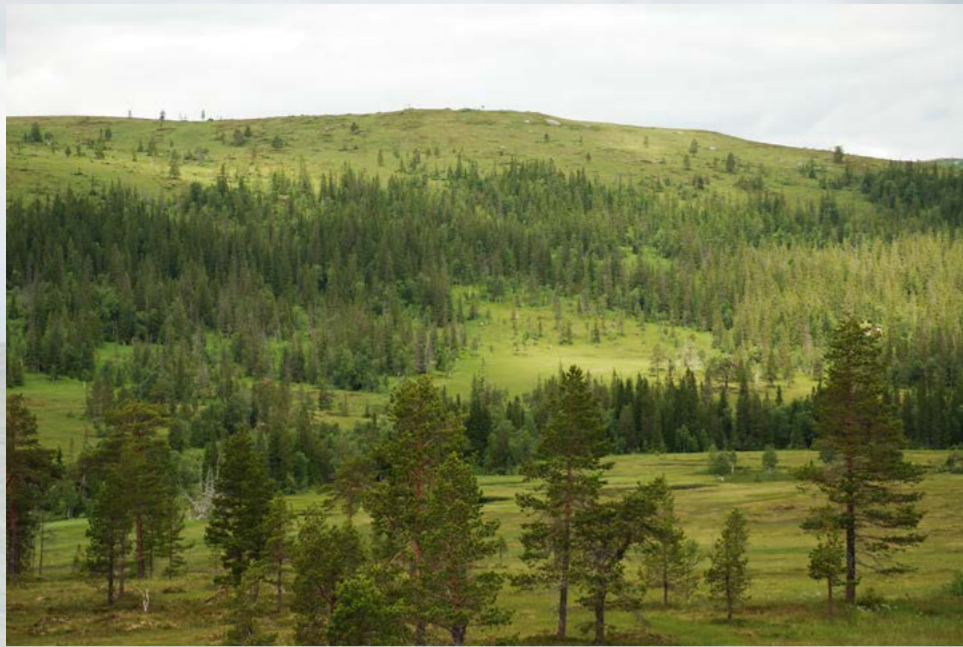
Heglesslættet (Slåttmyra) i Heglesvola sett fra Hundskinnset.