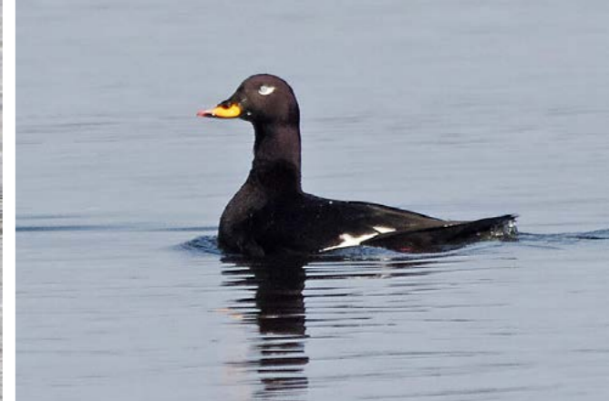
Sjørre ( Melanitta fusca )