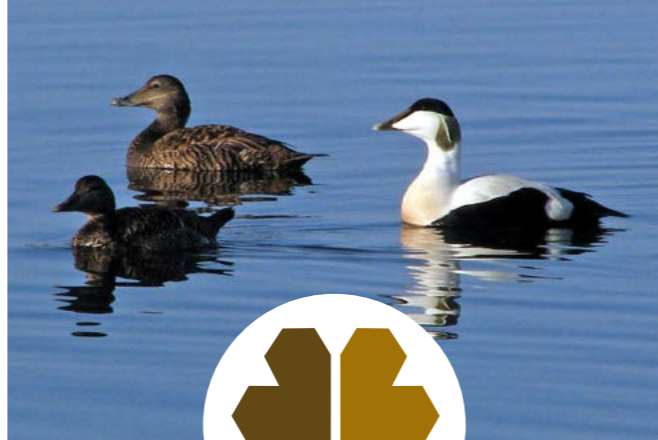
Ærfugl ( Somateria mollissima )