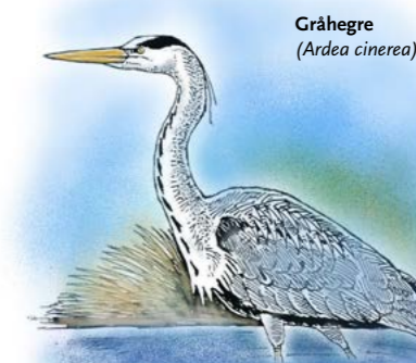
Gråhegre ( Ardea cinerea )