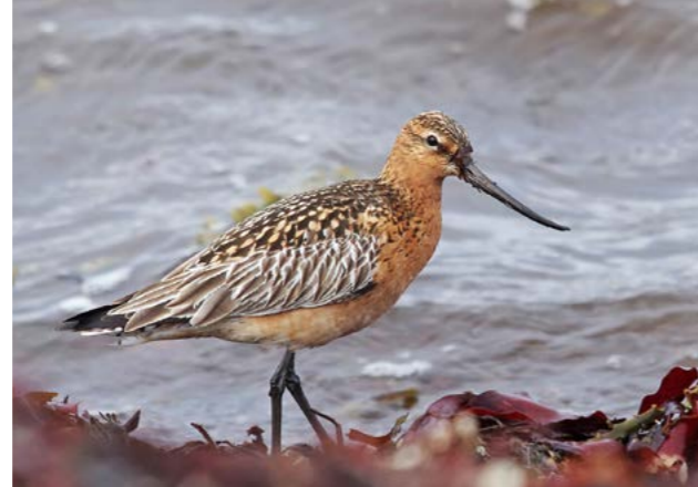
Lappspove ( Limosa lapponica )