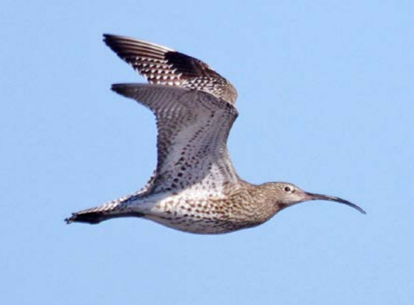
Storspove ( Numenius arquata )