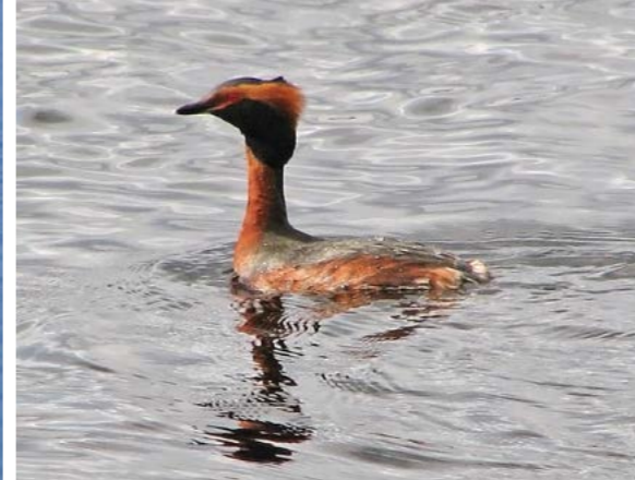
Horndykker ( Podiceps auritus ). Om våren kan flere horndykkere holde til i gruntvannsområdene i påvente av at isen på hekkesjøene skal gå opp.