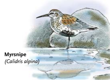
Myrsnipe ( Calidris alpina )

Våtmarkene er av de mest truede naturtypene vi har. De er utsatt for en rekke forskjellige inngrep som f.eks. utbygging, gjenfylling, neddemming, drenering og søppelfylling.