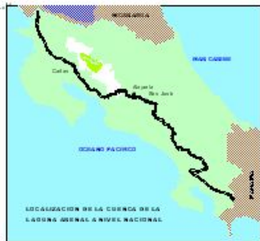
Fuente: Plan de Manejo y Desarrollo de la Cuenca del Embalse de Arenal, 1997