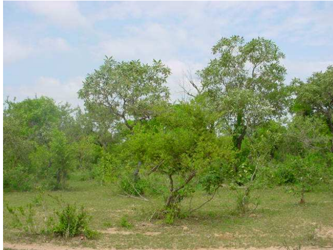
Photo n° 2 : Vue de la savane arbustive située sur la rive gauche du barrage de Bagré (B. A. ADOUABOU)

Certaines espèces sont devenues très rares sur le site. Il s'agit notamment de : Acacia elata , Bombax constatum , Combretum aculeatum , Combretum molle , Crossopteryx febrifuga , Daniellia oliveri , Ficus gnaphalocarpa , Ficus sp. Grewia sp. Lan acida , Maerua crassifolia , Parkia biglobosa , Securidaga longepedunculata , Terminalia macroptera , Ximenea americana , Ziziphus micronata .