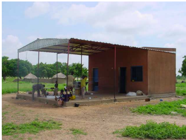
Photo n° 3 : Vue d'un centre de pesé du poisson sur la rive gauche du barrage de Bagré (B. A. ADOUABOU)

A Bagré la quasi totalité des pêcheurs sont de nationalité burkinabé. Cependant on rencontre d'autres nationalités: malienne, nigérienne et nigériane. Près de 40% des femmes épouses des pêcheurs travaillent dans la filière pêche. Ce sont elles qui assurent la transformation (fumage) du poisson. Elles sont également organisées au sein de 15 groupements et sont présentement au nombre de 217. La production moyenne depuis l'ouverture de la pêche en 1994 sur le lac, est de 975 tonnes par an pour un potentiel exploitable estimé à environ 1 500 tonnes par an.