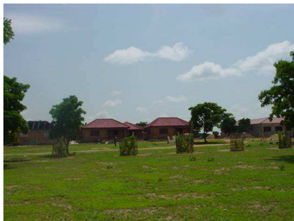
Photo n° 5 : Vue du Campement éco touristique de Bagré

L'écotourisme connaît un essor dans la zone du barrage de Bagré, ce qui a favorisé la construction (en cours) d'un campement éco touristique, dont le but est de participer à la valorisation des potentialités touristiques du site.