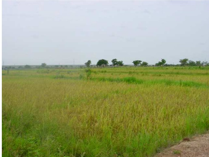
Photo n° 4 : Vue d'une partie de la plaine irriguée de Bagré (B. A. ADOUABOU)

L'élevage est extensif et est composé de bovins, ovins, caprins, porcins et volaille (poulets, pintades, canards, dindons). La majorité des ménages possèdent du petit bétail et de la volaille et certains disposent de bovins et quelquefois d'ânes. Environ 59% des ménages utilisent les services des ressources animales.