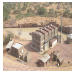
Photo 3 : Installation pour la production de l'hydroélectricité