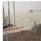
Photo 4 : Equipement de production de l'hydroélectricité