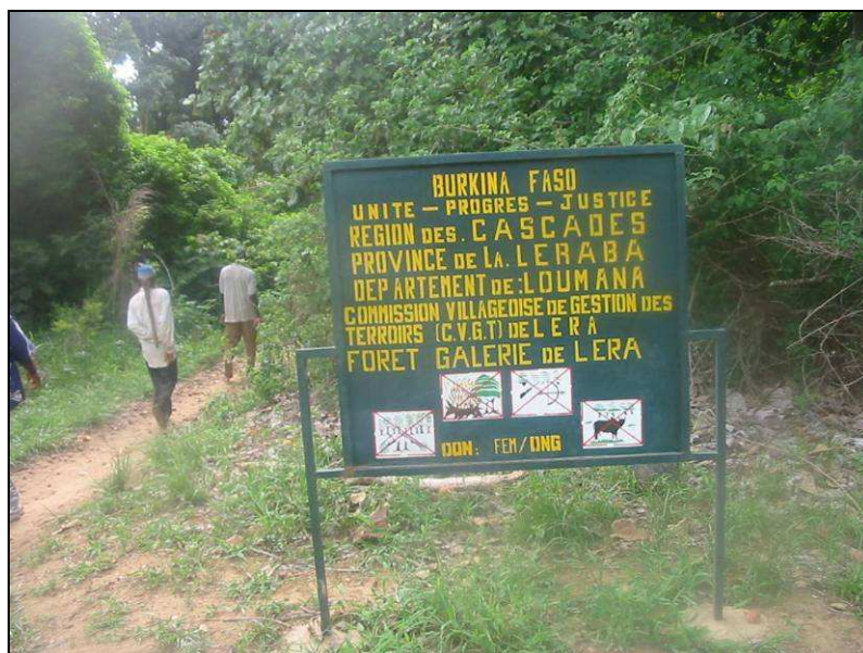
Photo 3 : Plaque signalétique de la forêt galerie de Léra (OUATTARA)

Avec l'appui des services forestiers de la province de Sindou, le comité villageois de gestion des terroirs de Léra a pu bénéficier d'un financement du FEM/ONG pour mener des activités de sensibilisation, de délimitation (plantation d'essences locales ( Ceiba pentandra , Kaya senegalensis , palmier à huile), de matérialisation avec des plaques de signalisation, d'ouverture de pare-feux.