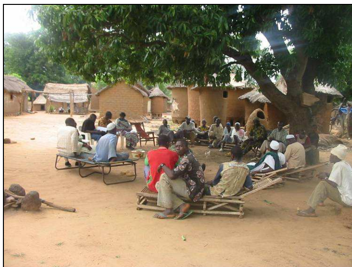
Photo 5 : CVGT de Léra en échange avec la mission de description du site (OUATTARA B.)

Le Comité Villageois de Gestion des Terroirs (CVGT) de Léra au (00226) 76 08 44 64 et le Ministère de l'Environnement et du Cadre de Vie à travers la Direction provinciale de l'Environnement et du Cadre de Vie de Sindou au téléphone (00226) 20 91 85 15 et à l'adresse 03 BP 7044 Ouagadougou 03. Burkina Faso.