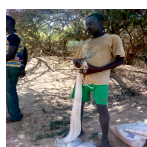
Photo 2: Engins de pêche utilisés dans le site Ramsar