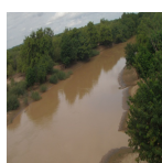
Photo 11: Vue panoramique du fleuve Mbuoun dans la commune de Tchéniba