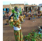
Photo 14: Vue des potentialités de la zone du corridor ( Projet EBA/FEM Burkina Faso, 11-01-2015 )