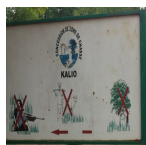
Photo 6: Panneau de signalisation de la concession de chasse de Kalo à l'intérieur du site