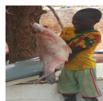
Photo 5: Poisson pêché dans le site Ramsar