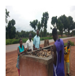
Dispositif pour la transformation du poisson à Togo-Mouhoun, localité riveraine du site Ramsar