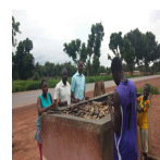
Photo 4: Transformation du poisson pêché dans le site Ramsar