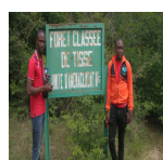
Photo 10: Panneau de signalisation de la Forêt classée de Tissé, une des 9 forêts classées comprises dans les limites du site Ramsar