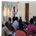
Photo 13: L'Expert Zones humides de la Cellule Ramsar du SP/CNDD déroulant le processus d'inscription du site Ramsar aux participants ( Projet EBA/FEM Burkina Faso, 21-09-2017 )