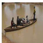
Photo 7: Transport sur la portion du fleuve dans la forêt de Kari (commune de Tchéniba)