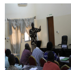
Photo 18: Le Point Focal national Ramsar achevant de convoquer les participants de l'atelier sur les valeurs et avantages du site Ramsar pour les collectivités territoriales ( Projet EBA/FEM Burkina Faso, 21-09-2017 )