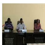
Vue du présidium composé des autorités des 2 régions administratives du corridor lors de l'atelier de restitution et d'appropriation du processus par les acteurs du niveau régional à Dédougou le 21 septembre 2017. On y aperçoit le Chef d'Antenne du Projet EBA/FEM initiateur du processus à la droite