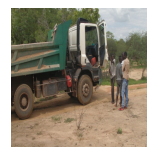
Photo 9: Transport d'agrégats (le sable) prélevés dans les limites du site Ramsar