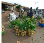
Photo 12: Aperçu des potentialités du site en Produits forestiers non ligneux (PFNL) précisément le fruit de Saba senegalensis dans la commune de Tchérba ( Projet EBA/FEM Burkina Faso, 11-01-2015 )