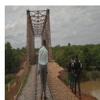
Photo 8: Passage du chemin de fer sur le principal cours d'eau dans le site Ramsar