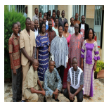
Photo 15: Photo de famille des participants à l'atelier de restitution et d'appropriation du processus par les acteurs du niveau régional à Dédougou le 21 septembre 2017