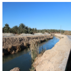
CANAL DE OUED RIGH ( Conservation des forêts Et Oued , 09-06-2017 )