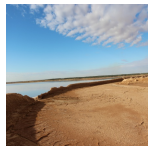
CHOTT MEROUANE ( Conservation des forêts Et Oued , 10-06-2017 )

Fournir au moins une photographie du site: