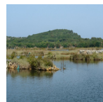
Parc National d'El Kala ( Lac ElMellah , 15-07-2013 )