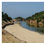
Parc National d'El Kala ( Embouchure du lac ElMellah , 13-06-2012 )

Fournir au moins une photographie du site: