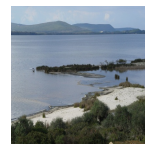
Parc National d'El Kala ( Lac ElMellah , 02-04-2011 )