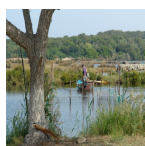
Parc National d'El Kala ( Lac ElMellah , 14-05-2014 )