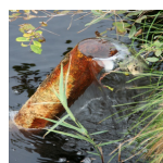
Puits artésien dans les Marais de Sacy ( Syndicat Mixte des Marais de Sacy, 2015 )