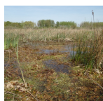
Herbiers aquatiques au sein des Marais de Sacy ( Syndicat Mixte des Marais de Sacy, 2017 )