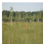
Vaches Highland Cattle dans un marais privé ( Syndicat Mixte des Marais de Sacy, 2016 )