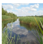
Roselière inondée dans le marais de Labruyère ( Syndicat Mixte des Marais de Sacy, 2016 )