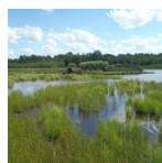
Hutte de chasse dans le marais de Les Ageux ( Syndicat Mixte des Marais de Sacy, 2017 )