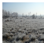
Les Marais de Sacy en hiver ( Syndicat Mixte des Marais de Sacy, 2016 )