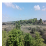
Les Marais de Sacy vus de la tour d'observation ( Syndicat Mixte des Marais de Sacy, 2017 )