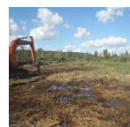
Travaux de déboisement dans les Marais de Sacy