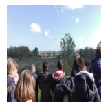
Visite d'une école dans les Marais de Sacy ( Syndicat Mixte des Marais de Sacy, 2017 )