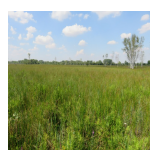
Les prairies tourbeuses de la Renardière ( Syndicat Mixte des Marais de Sacy, 2016 )