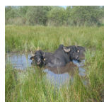
Pâturage par le Buffle domestique dans le marais de Monceaux ( Syndicat Mixte des Marais de Sacy, 2014 )