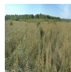
Vaste cladiaie au marais de Les Ageux ( Syndicat Mixte des Marais de Sacy, 2017 )