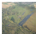
Marais de Sacy vus du ciel

Fournir au moins une photographie du site: