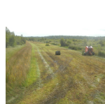
Fauche exportatrice dans le marais de Monceaux