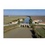
Les Cinq Abbés ( PNR Marais poitevin, 2014 )