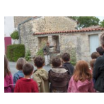
Animation auprès d'enfants ( PNR Marais poitevin, 2007 )