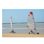
Char à voile sur une plage vendéenne ( PNR Marais poitevin, 2015 )