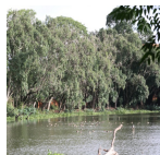
lac habitat des oiseaux ( Rivo Rabarisoa, 2016 )