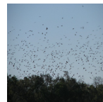
chauve-souris ( The Peregrine Fund, 2010 )