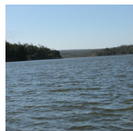
paysage ( The Peregrine Fund, 2010 )