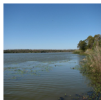
paysage ( The Peregrine Fund, 2010 )