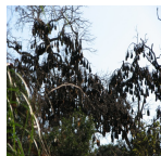
chauve-souris ( The Peregrine Fund, 2010 )

Fournir au moins une photographie du site: