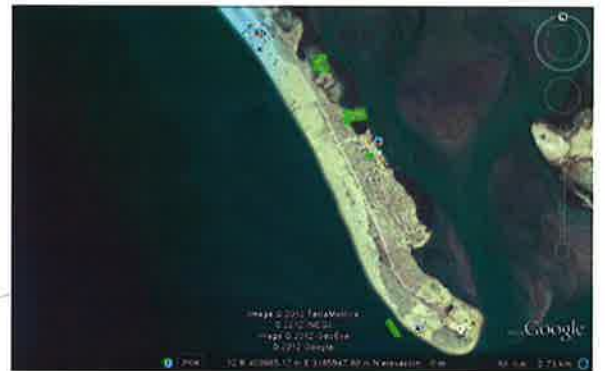
Figura 5b: Concesiones en trámite adyacentes a la Laguna La Cruz.