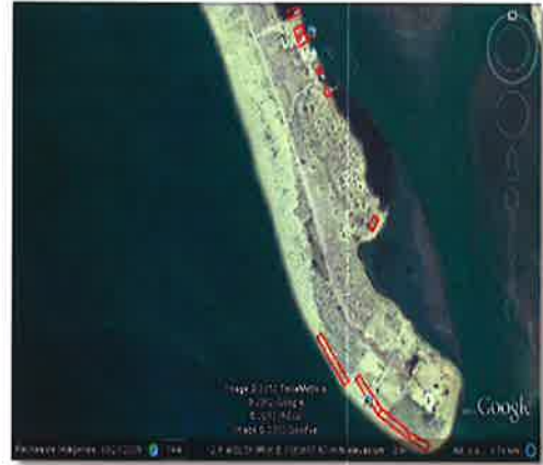
Figura 5a: Concesiones actuales en la Laguna La Cruz.