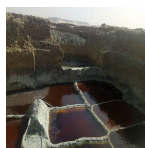
Oasis du Kawar