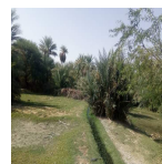
Oasis du Kawar (, 27-10-2017)