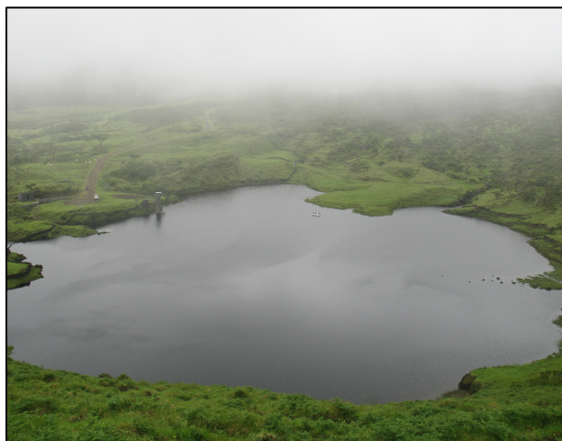
Foto 3. Lagoa do Paul