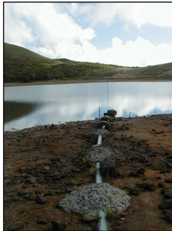
Foto 2. Captación de Agua. Lagoa do Caiado