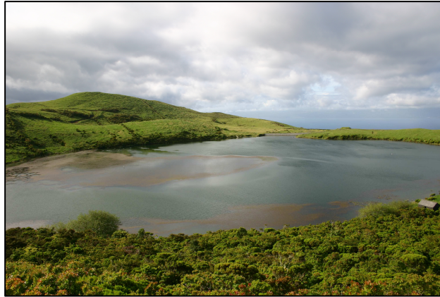
Foto 1. Lagoa do Caiado