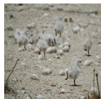
POUSSINS DE STERNES ROYALES (, 27-05-2015)