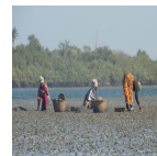
FEMMES EN ACTIVITES DE RAMASSAGES DES ARCHES DANS LES VASES DE LA ROK